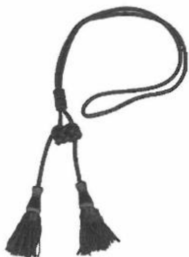
Cordoniera di colore rosso Cancelliere