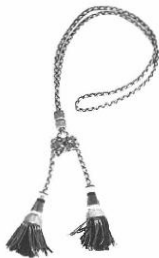
Cordoniera di colore nero e argento Avvocato