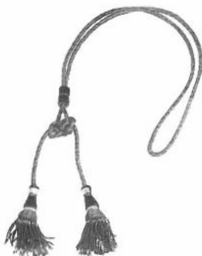
Cordoniera di colore oro Magistrato di Cassazione