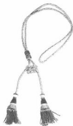
Cordoniera di colore argento Magistrato