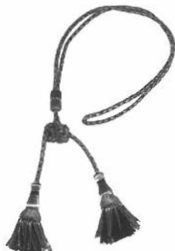
Cordoniera di colore nero e oro Avvocato di Cassazione