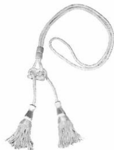
Cordoniera di colore bianco Uditore